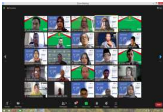
Foto-Foto Kegiatan Assesmen Lapangan Daring (ALD) Program Studi Magister Fisika